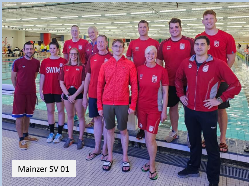
Mainzer SV 01